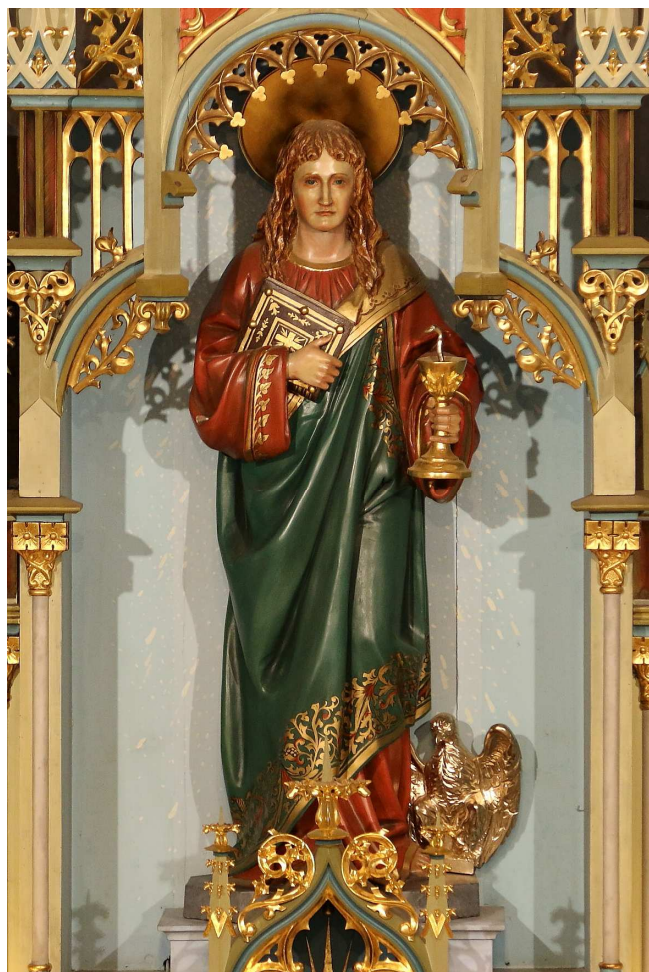
Hlavný oltár nášho kostola – Sv. Jána Evanjelistu