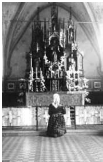
Hlavný oltár v kostole Sv. Jána Evanjelistu.