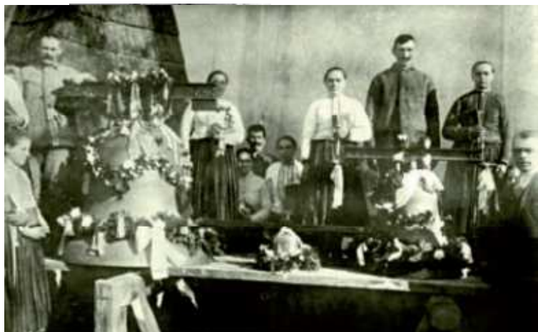
Posviacka zvonov v roku 1925.