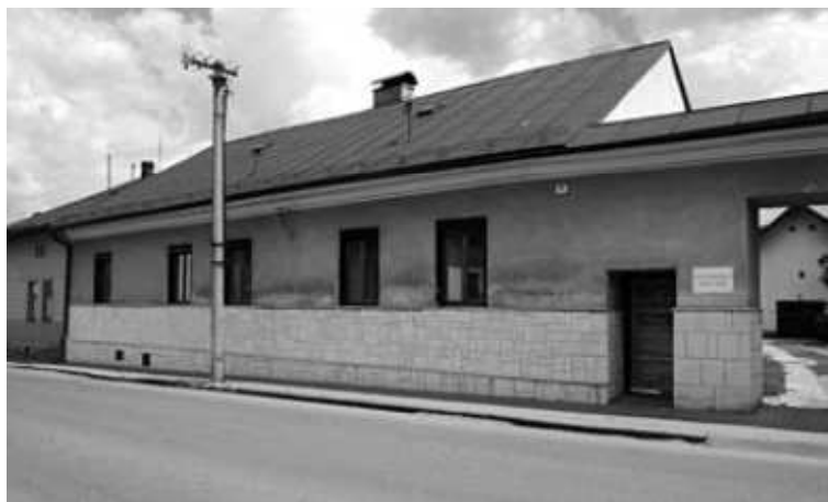
Rímskokatolícky farský úrad.