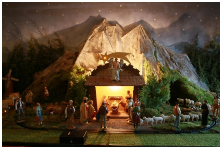
Betlehem v kostole

Ešte v čase Rakúsko-uhorskej monarchie, 15. apríla 1858, bol v obci založený Spolok Sedembolestnej P. Márie a v roku 1893 Spolok sv. Ruženca, ktorý po utvorení československého štátu pokračoval vo svojej činnosti a v roku 1943 mal 350 členov. V obci ďalej pôsobil Katolícky kruh, Odbočka ústrednej karity (charity), ktorá bola charitatívnym spolkom rímskokatolíckej cirkvi (jej stanovky boli schválené 30.6.1928), Združenie katolíckej mládeže, ktorého stanovky boli schválené 12.3.1937.