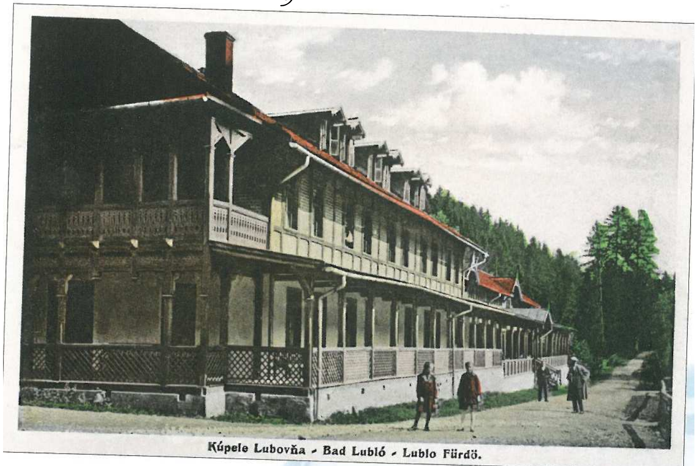
Kolorovaná pohľadnica kúpeľného domu z roku 1919.