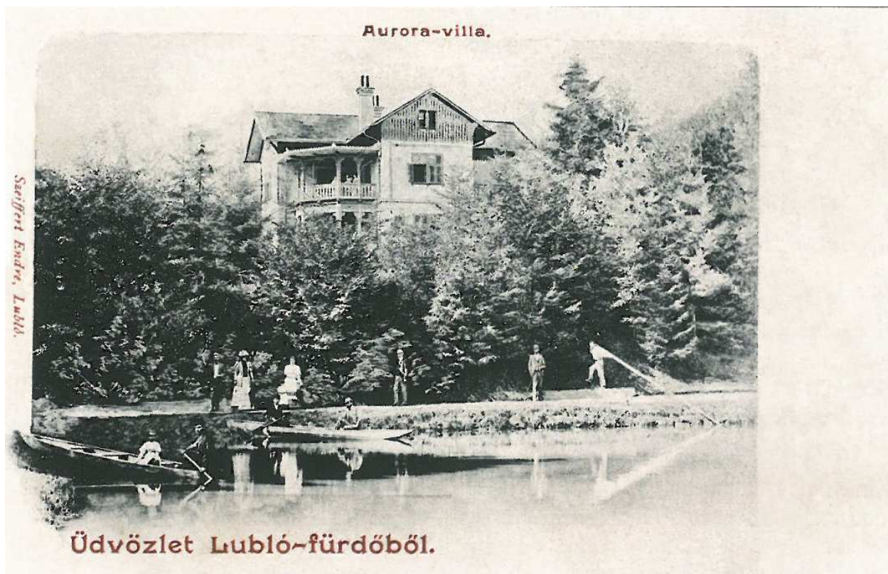
Vila Aurora z roku 1902 – neďaleko jazierka