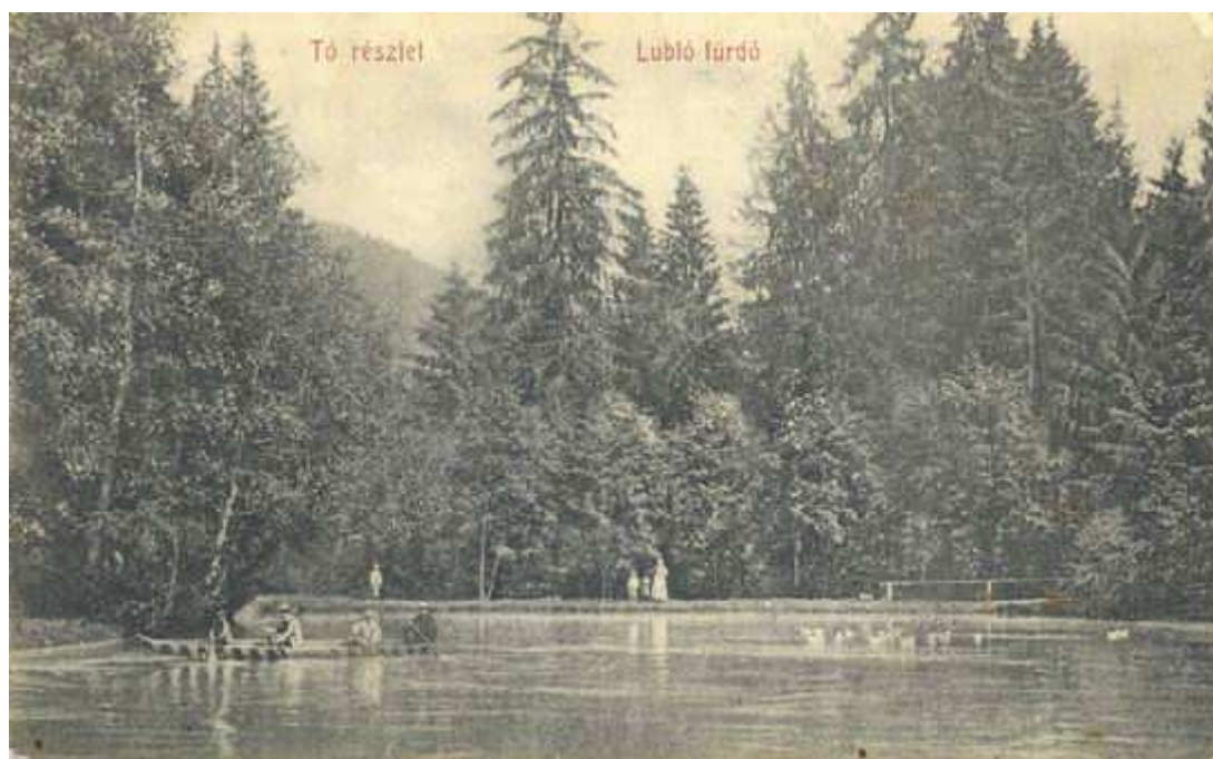
Jazero v kúpeľoch (1910)