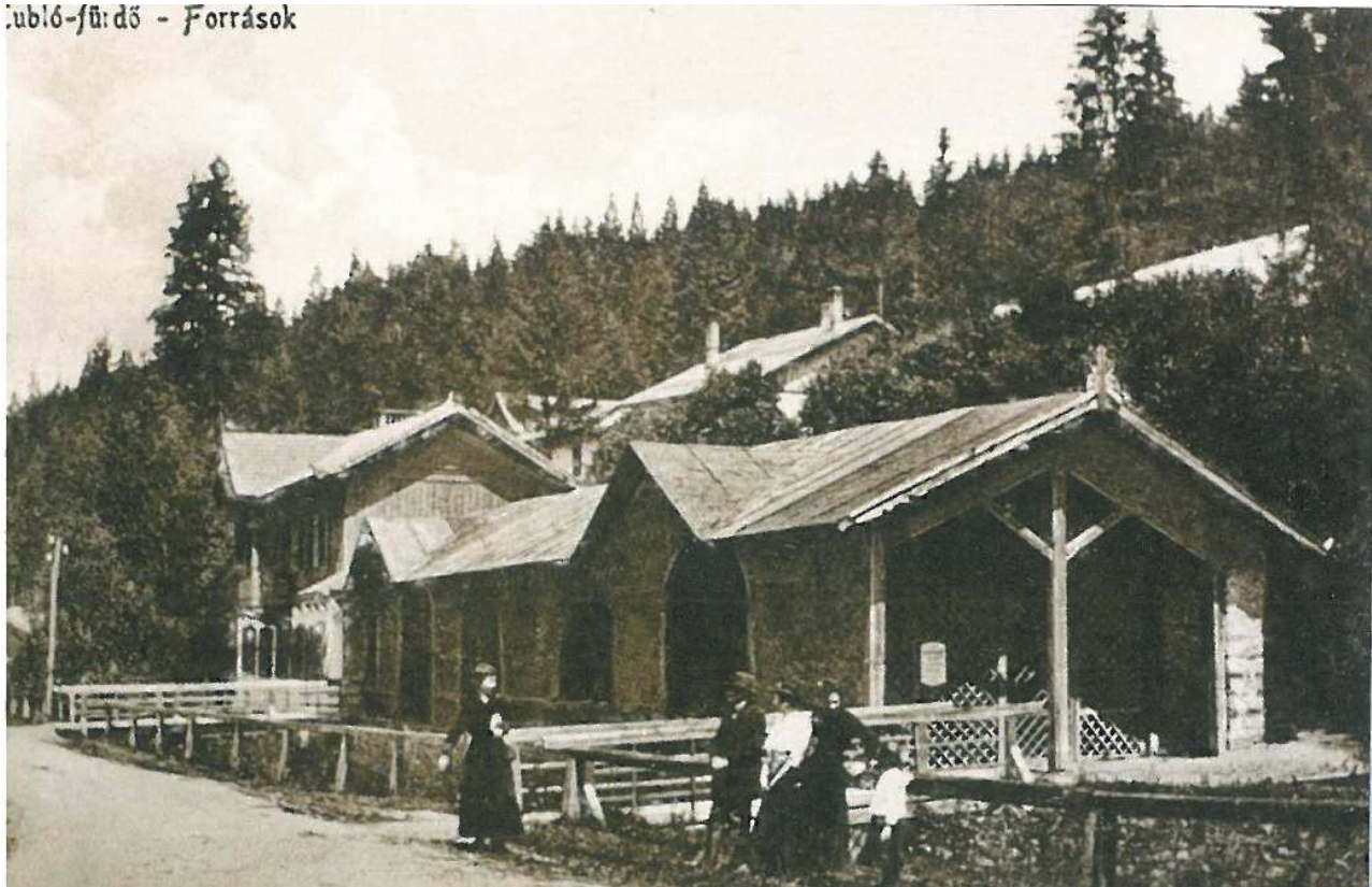
Drevená kolonáda pri pitných prameňoch, okolie bolo upravené na rozsiahly lesopark. (1910)