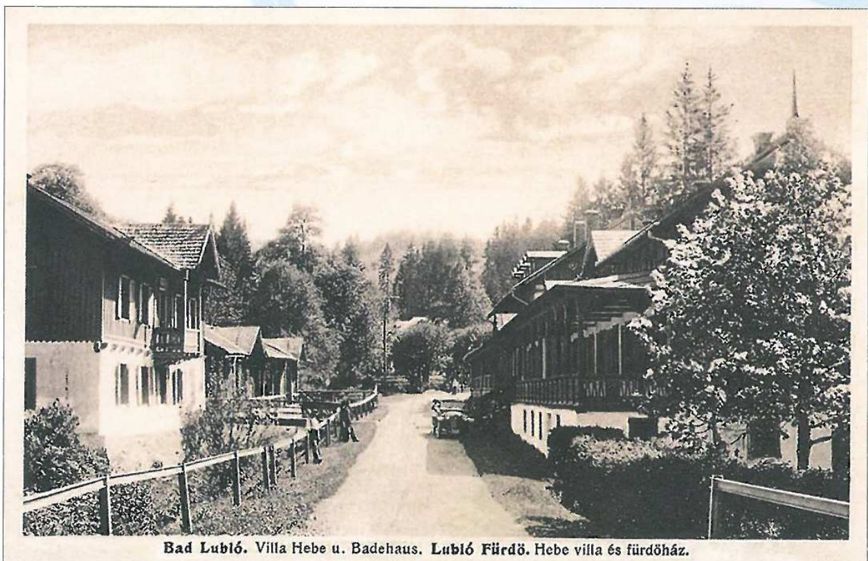
Vila Hebe, ktorá stála oproti kúpeľnému domu s veľkou verandou (1926)