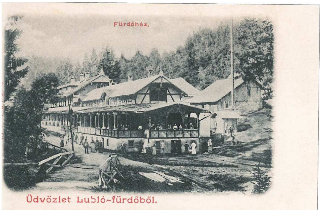
Pekný hrazdený kúpeľný dom v švajčiarskom štýle v roku 1905 v ihličnatom lesoparku.