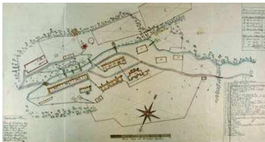
Plán kúpeľov z roku 1806. Repro I. Chalupický