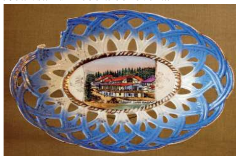
Suvení s maľbou kúpeľného domu zo začiatku 20. storočia. Archív Ľubovnianskeho múzea

Po prijatí zákona číslo 125/1948 Zb. o znárodnení prírodných liečivých zdrojov a kúpeľov a o začlenení a správe konfiškovaného kúpeľného majetku sa ešte rávalo so zavedením liečby. V roku 1948 sa začalo s obnovou schátralých ubytovacích a liečebných objektov, ktorú uskutočňovala Východoslovenská stavebná spoločnosť so sídlom v Starej Ľubovni. Práce na oprave budov sa skončili v roku 1950. 23 Obnovené boli iba tri jednoposchodové budovy. Ostatné boli zbúrané. Kúpeľná liečba však už nebola obnovená.