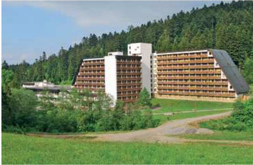
Hotel Lubovňa.