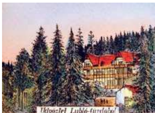
Maľba kúpeľného domu na tanieri začiatok 20. storočia.