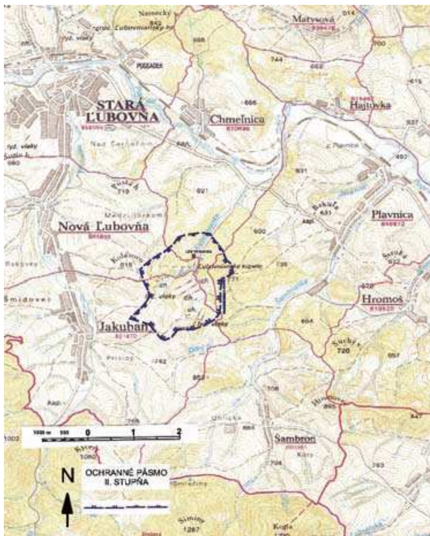
Mapa s vyznačením ochranného pásma v Novolubovnianských kúpeľoch