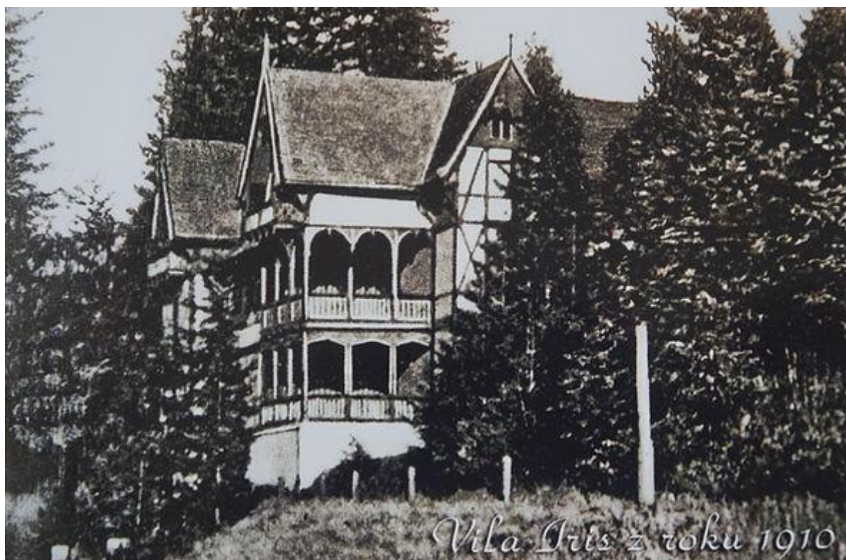
(Pozn. Materiál bol uverejnený v Ľubovnianskych novinách č. 19, 15. máj 2024)