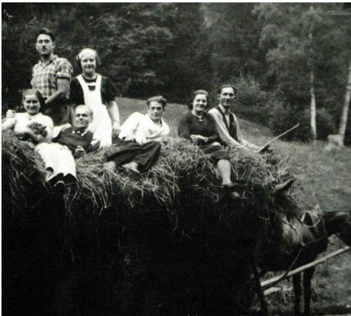
V kúpeľoch to žilo, pracovali tu ľudia z okolitých obcí a kúpeľní hostia radi využili aj atraktívne vozenie sa na sene či člnkovanie v jazierku.