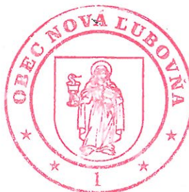
pečiatka a podpis zodpovednej osoby užívateľa